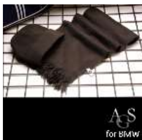
BMW München, Deutschland