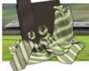
Vossloh AG, Werdohl, Deutschland