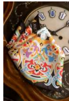
RFT, Real Fabrica de Tapizes Spanien