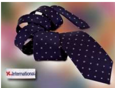
AKZO Nobell, Spanien