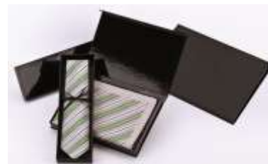
Vossloh AG, Werdohl, Deutschland