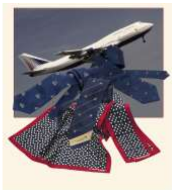
Transaero, Moskau, Russland