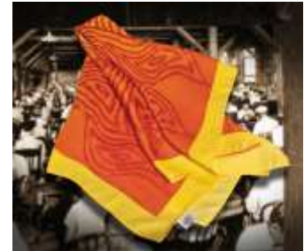
LA PAZ, Cigarren, USA