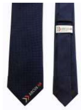
Arcus Airlines, Deutschland