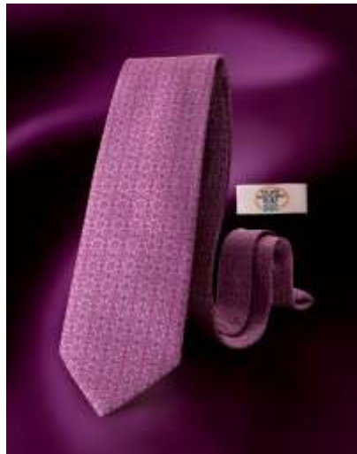
Hotelfachschule Sevilla, Spanien