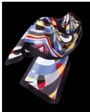
OASIS Exclusive, Russland