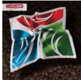
Cafe Creme Cigarillos, Spanien