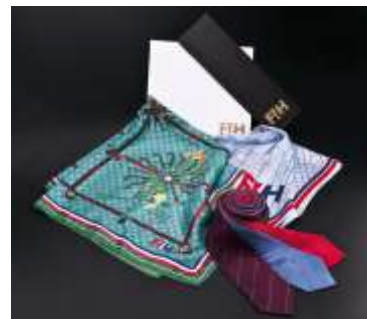
Federation International Hockey, Lausanne, Schweiz