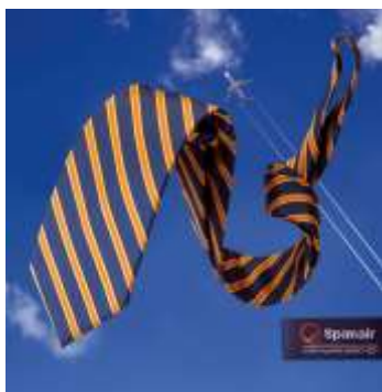
Spanair Airline, Spanien