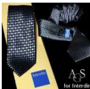
Interdin Broker, London, England