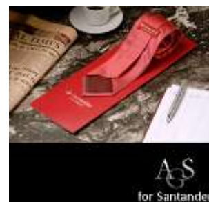
Santander Bank, Spanien