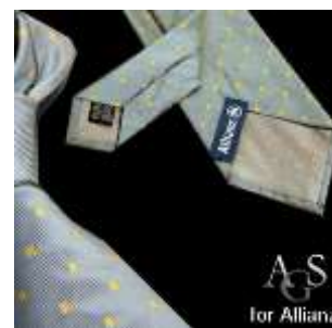
Allianz Versicherung, Spanien