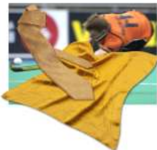
Federation International Hockey, Lausanne, Schweiz