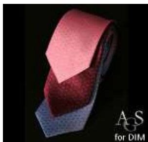
DIM Paris, Frankreich