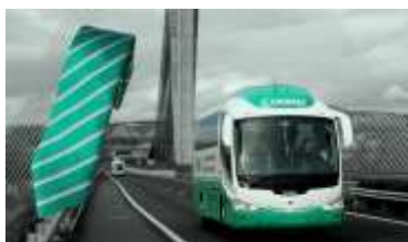
Canals Transports, Spanien