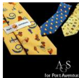
Port Aventura Tarragona, Spanien