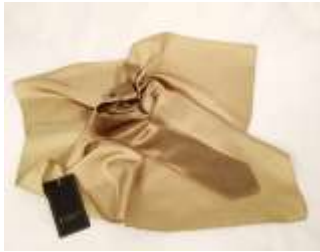
Holmes Fitness, Österreich & Schweiz