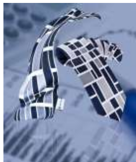
Bank Azerbaijan, Moskau, Russland